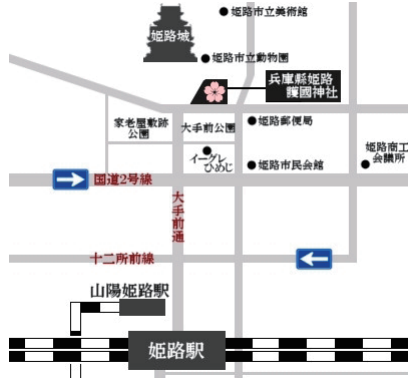
姫路会場: 姫路護国神社 護国会館