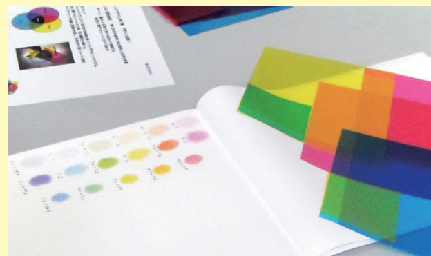
◆発表7(光武)：研究発表の一カット