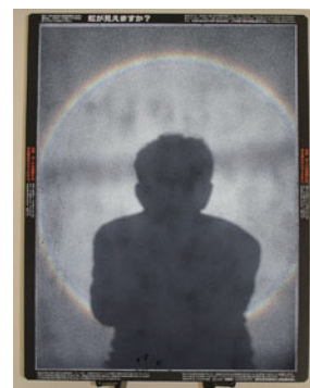
ブロッケン妖怪の実験