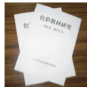
配布資料：色彩教材研究