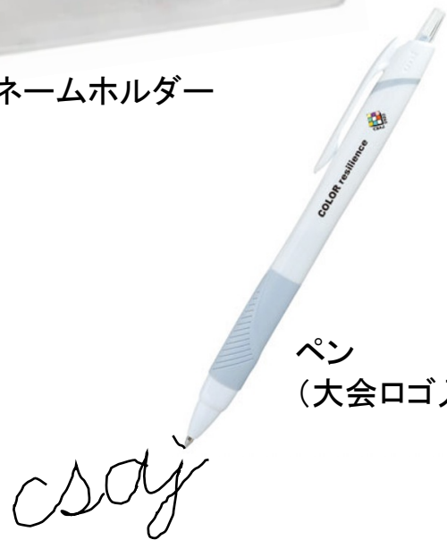
ペン (大会ロゴ入り)